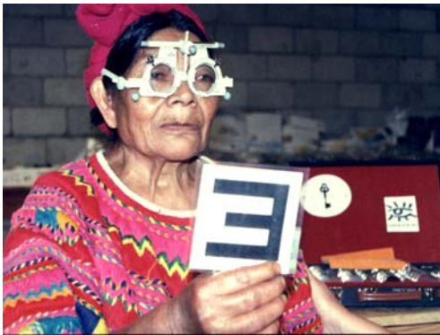
Guatemala, 2003. Nytt arbetsmål utforskat.