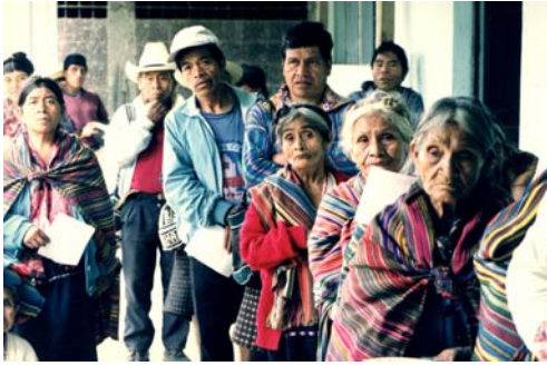
Kö till undersökningen. Guatemala, 2003.